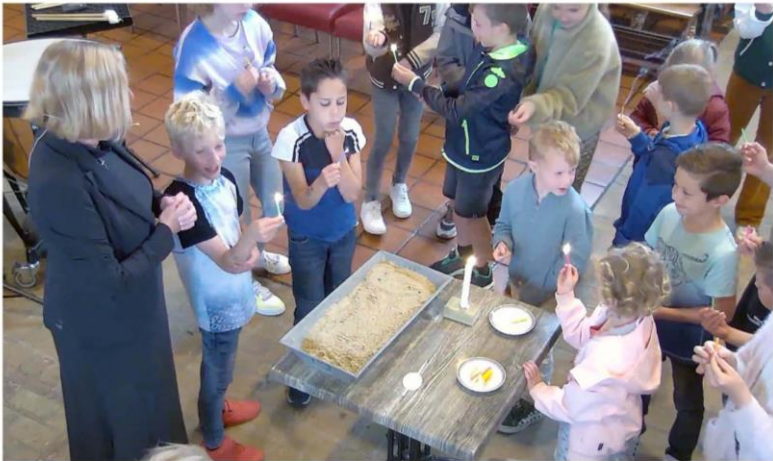
Clusterdienst 26 mei