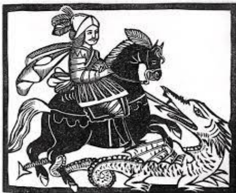
Sint Joris en de draak (St. George and the dragon) 16e eeuwse houtsnede.