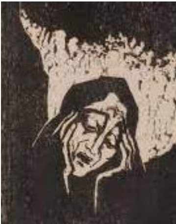
Afbeelding; Jakob Steinhardt, houtsnede 1965